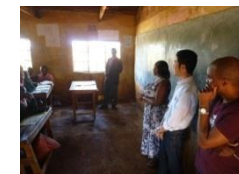
(ケニアムワンバ小学校)