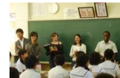
(中学校理解教育講座)

また、カカメガの現地ハウス事業地へのインターンやスタディーツアーの受け入れや、国内のJAT大豆畑での農業実習などを行っています。