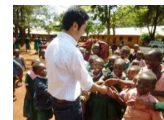
(ケニアムワンバ小学校)