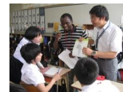
(中学校理解教育講座)