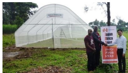
(ケニアカカメガ事業地)

また1963年のケニア独立以来、農業はケニア経済の頼みの綱と呼ばれています。しかしながら、高い人口増加率、農業に適した土地の縮小、乏しい技術の為、大規模農業以外の農業収益率は非常に低いという問題があります。マイクロエンパワメント事業では、小規模収益事業のグリーンハウスを広め、貧困改善を支援していきます。